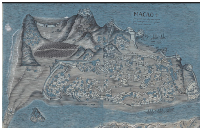
圖 2 1880 年澳門全景圖

很少能夠在多科學交叉、不同研究方法互動中把街道研究中的“微觀與宏觀”“體驗與想像”“在地與全球”進行有機的結合。以下謹對上述涉及的主要內容做簡要的介紹與探討。