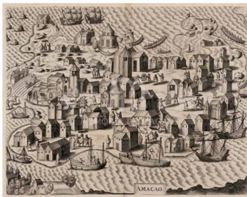
圖6 畫家錢納利畫作中的澳門街道

總體來看，目前學界對於澳門街道與城市社會探討相對較少，研究力量比較薄弱，多是对基本管理機制的研究，很少對澳門街道與人口、性別、景觀、城市管理、填海史、市政工程、軍事治安、民俗信仰、交通工具、族群認同、公共衛生、空間生產等問題進行研究，缺乏多學科交叉、不同研究方法結合互動的探討，也很少能夠從城市社會學的視角進行澳門街道在地研究。