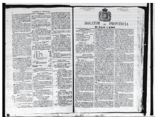
圖 5 澳門憲報刊登有關澳門街道檔案

變，認為澳門街道名冊體現了澳門城市地理變遷、葡澳政府行政區域化思想的變遷及大量澳門街道的文化資訊。金國平先生則從語言學與歷史學的角度，探討了“Bazar”這一史地範圍與特定含義，認為“Bazar”這一概念具有營地市（營地街市）和營地街市墟亭兩個指稱範圍。梁毅鵬則對澳門街道最原始的命名情況及中葡文名進行了比較、分析與解讀，認為昔日歷史上的澳門街道命名背後具有澳葡政府殖民性政治意涵。由此可見，學者們對於澳門街道名及澳門街道的名冊的相關問題給予了相當的關注，做了較為深入的探討，研究成果較為豐碩，但在研究方法還有待不同學科的綜合性探討，在研究成果也有待進一步視覺化和立體化。