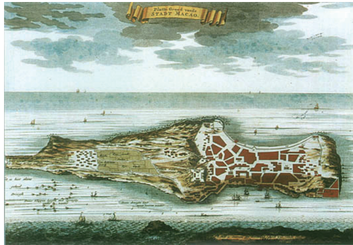
圖1 16世紀60年代荷蘭出版的早期澳門地圖

長期以來，澳門城市街道的獨特魅力吸引了較多學者的關注。早在1632年由葡萄牙人巴雷多·雷曾德（Pedro Barreto de Resnde）神父所繪的《澳門要塞圖》和1751年由印光任和曹汝霖編纂的《澳門紀略》的澳門圖中就有對澳門街道的清晰標識。在《香山縣誌》、《南海縣誌》《廣東縣誌》《澳門公牘錄存》等地方文獻資料中對澳門街道也都多有涉及。19世紀中後期，隨著澳門經濟的發展、填海面積的不斷擴大，時任澳門葡萄牙總督亞馬留為徵稅，在1847年2月23日命令議事亭命名所有道路，公佈了第一批街道名稱，並在之後不斷修訂擴展。