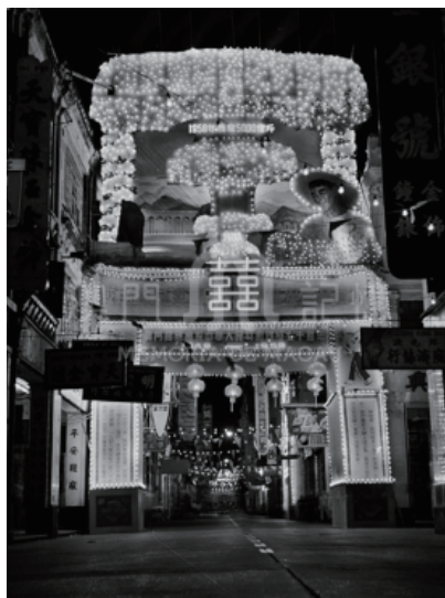
圖 4 1959 年澳門街道上的國慶牌樓

當然也有其他的一些研究人員基於地理學的角度對澳門街道的整個發展歷程以及澳門街道對澳門城市擴張所產生的影響作用進行了全面的探討和深入的分析。吳宏岐在《新橋：從鄉村到城區的歷史變遷》一文中對澳門新橋地區從鄉村到城區的歷史變遷中街道的演變進行了梳理，認為新橋地區主要街道建築與結構和當時澳門的填海工程聯繫密切。而王維仁在《澳門歷史街區城市肌理研究》一文中則認為澳門歷史城區沿山脊線興建，由序列地標建築及廣場形成一條線性空間走廊街道沿著等高線發展，在此架構之下構成了澳門城市街廊的基本結構，澳門在葡人建造出的教堂、街道、廣場組成的街道結構中又交織了由華人所形成的“圍”“里”“巷”這一城市肌理，“里”“圍”等是澳門獨特的都市肌理類型。邢榮發考察了澳門馬交石及其相關地域變化及其街道命名情況並進行了研究，認為其與澳門發展相若，都是基於中葡兩種文化的差異，在各個歷史發展時期地域概念的變化，以及城市文化與鄉村文化之間的差別中產生了複雜的人文現象。