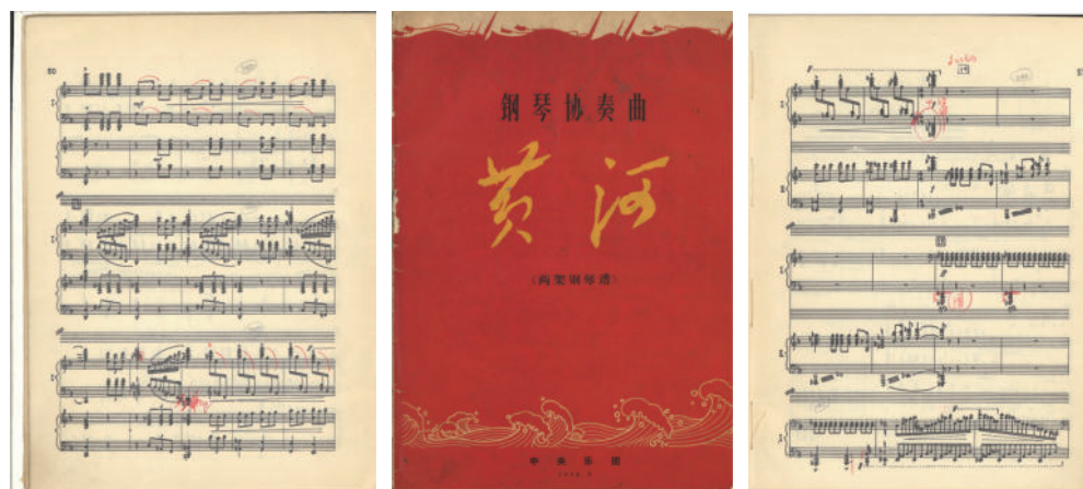
圖 1-2(《黃河鋼琴協奏曲》雙鋼琴譜)

受限於當時的客觀條件，樂隊的聲部人員編制並不齊全，就算有人演奏該聲部，也在人員數目上不達標準，有些弦樂的聲部甚至是一人一聲部。就算是在這種條件之下，也無阻他們練習的認真、排練的熱情與演出的投入。不過，從一個自嘲的角度來講，一個這樣的小型樂隊，配以一臺立式的鋼琴，可也算是恰到好處，演奏一套這麼大型曲目就顯得有那麼點勉為其難了。