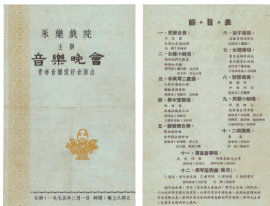
圖 4-2 (報章廣告)

由於是次春節音樂晚會的成功，令所有參演人員士氣高漲，組織者又向大家建議把整套曲目搬到澳門工人康樂館中，再次向廣大工人與澳門市民再演一次。有關建議馬上得到了大家的一致認同和肯定，於是演奏員們又在 2 月 17 日到澳門工人康樂館，將整部《黃河鋼琴協奏曲》再演一遍，引起了社會上非常好的反響。這次演出之後組織單位和有關人士對樂隊指揮與鋼琴獨奏充分肯定和讚譽，因此他們決定為兩位人士量身定制一套演出服，為將來的持續演出做好準備。