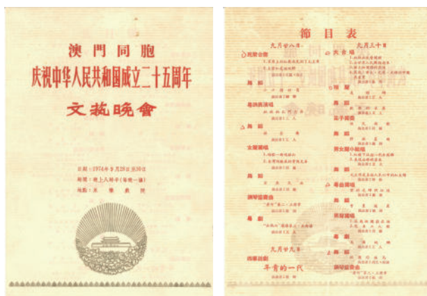
圖 2-1 (國慶晚會節目單)

由於《黃河鋼琴協奏曲》的這兩個樂章總演奏時間不長，而組織當年慶祝國慶二十五周年的文藝晚會又定性為一個綜合的文藝晚會，因此在這個晚會之中就安排了很多別的節目，包括合唱、民樂合奏、甚至是舞蹈、相聲、粵劇等，而有份量的音樂節目就以《黃河鋼琴協奏曲》的第二、第三樂章為最重。通過晚會中每個節目表演者的努力，一臺澳門同胞慶祝中華人民共和國成立二十五周年文藝晚會終於準備充份，於 1974 年 9 月 28、29、30 日一連三天，每晚在永樂戲院上演一場。演出消息一經公佈，晚會的門票馬上一售而空。這種以本地愛國人士所組成的一臺節目，當時而言在港澳地區都是一個創舉。由於該晚會帶有很強的政治意義跟愛國思潮，因此澳門所有重要的人物，特別是社會華人賢達，也包括香港的有關人士紛紛出席。晚會演出之後在社會上造成了廣泛的正面影響，特別是在 9 月 28 跟 9 月 30 日這兩天的文藝綜合表演中，還達到了不錯的藝術水準。因此這一次國慶文藝晚會就成為當年以及那個時代的一次重要音樂演出活動。從後來所留下來的各種報章報導中可以看到，當時這個演出