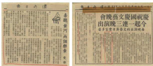
圖 2-2 (報章報導)