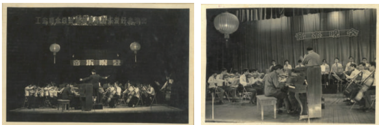
圖 4-4 (音樂晚會演出舞臺劇照)

自此之後，相關演出獨奏和指揮就可以穿上正式的中山服，在臺上展演風采，不需要再像第一次國慶文藝晚會時，祇能穿上白色襯衫上臺。