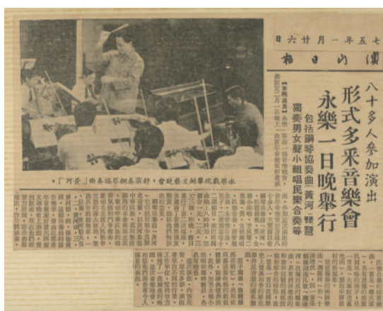
圖 4-3 (報章報導)