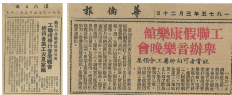
圖 5-3 (報章廣告與新聞報導)

這次《黃河鋼琴協奏曲》在澳門舞臺上的呈現，可以說是上世紀 70 年代時澳門最重要的音樂演出活動，標誌著澳門的音樂演奏水準和音樂教育水準都逐漸由專業人士擔任，並取得了良好的正面效應。