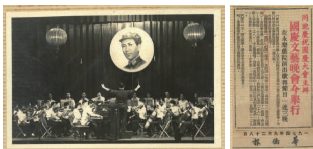
圖 2-3 (演出舞臺劇照，報章廣告)