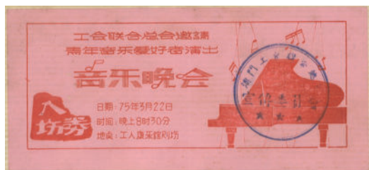
圖 5-1 (音樂晚會節目單)