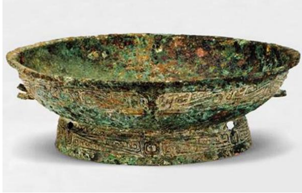
圖 1 士山盤器型