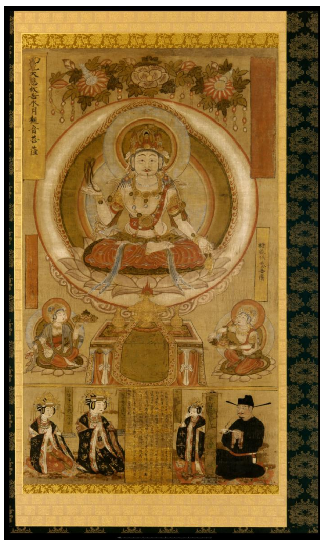
圖 6 美國弗利爾美術館，斯密森尼學會 (Smithsonian Institute) 1930. 36