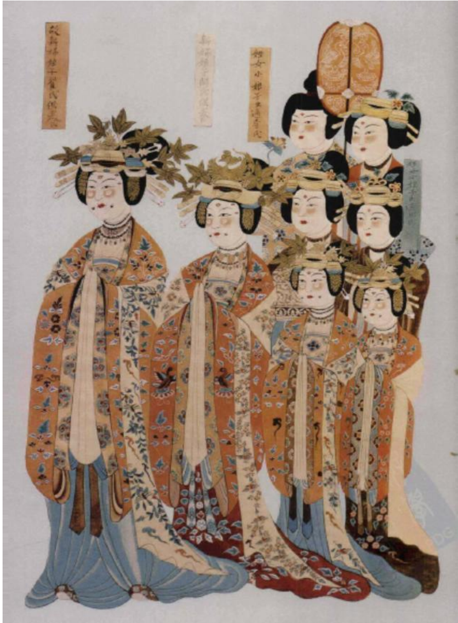
圖 4 莫高窟第 98 窟曹氏家族女性供養人服飾