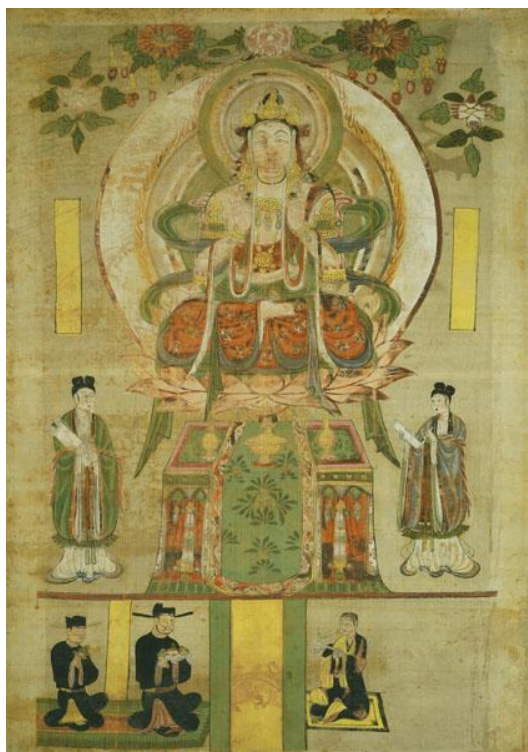
圖 8 E0. 3581