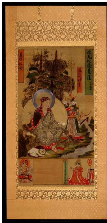
圖 9 弗利爾美術館, 史密森尼學會 1935. 11