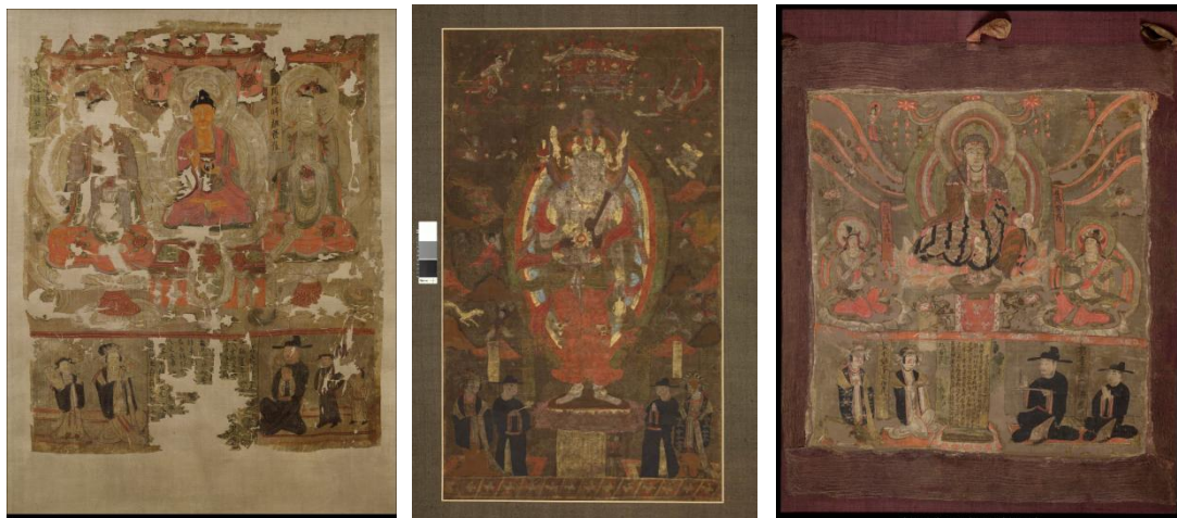
圖 5 左：1919, 0101, 0. 41