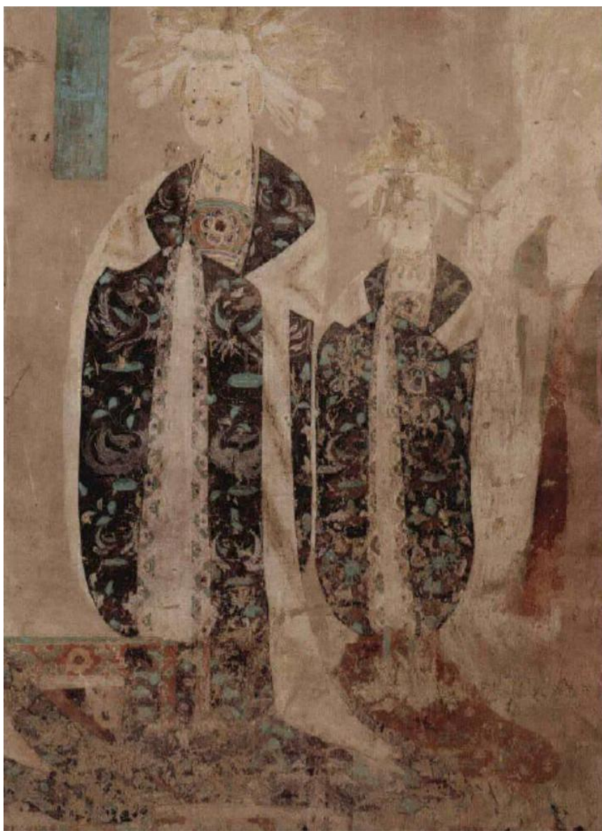
圖 3 莫高窟第 138 窟女性供養人服飾 晚唐

敦煌藏經洞發現的這類絹畫中的供養人服飾與晚唐時期莫高窟壁畫中的供養人服飾基本一致。尤其是女性供養人的服飾和發式。如晚唐莫高窟第 138 窟東壁著花釵禮服的郡夫人，是晚唐敦煌壁畫中最尊貴的貴婦禮服（圖 3），根據唐代禮制規定，這種九枝花釵冠屬於一品夫人禮服，這種禮服還可以在莫高窟第 98 窟東壁節度使曹議金家族貴婦、五代宋初莫高窟第 454 窟節度使曹延恭夫人（圖 4）、莫高窟五代第 61 窟主室東壁兩側的曹氏家族女性供養人的服飾中頻繁看到。