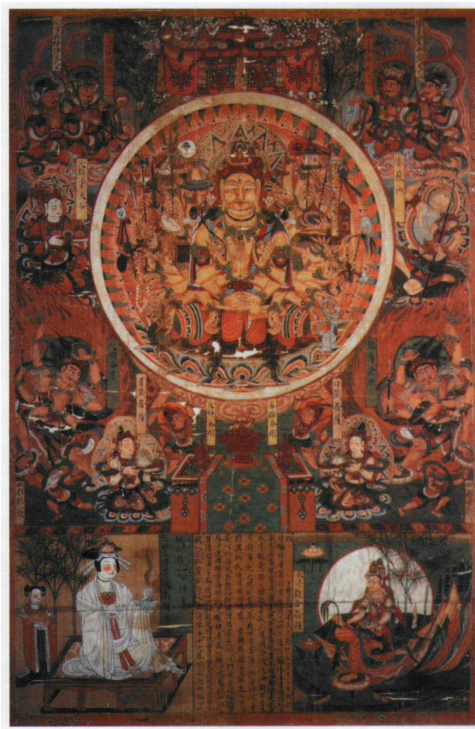
圖 10 法國吉美博物館藏 17775 號絹畫

再回到前面討論的幾幅題記框內和供養人位置有空白的絹畫，這些空白處應該是畫工專門預留出來給出資人的，出資人可以根據自己的需要加上自己想要的畫像或者發願文。這種現象在歐美藝術品創作中也不鮮見。貢布裏希在研究美第奇（Medici）家族所贊助的藝術作品時，就發現藝術作品受到捐贈人影響的程度，甚至可以說藝術品的創作很多時候是來自贊助人，而非藝術家。莫高窟壁畫的繪製很多需要依賴粉本，而以上所討論的這類藏經洞絹畫的製作又與粉本不同，是通過為贊助人“預留”空間的方式來滿足贊助人的捐贈意願。