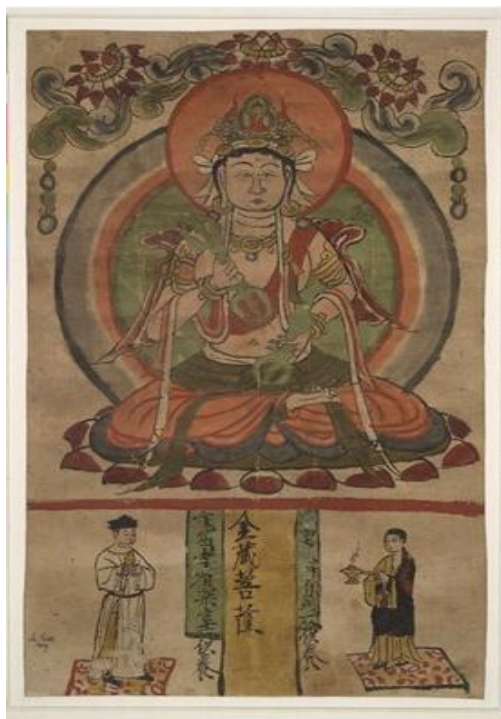
圖 11 英國博物館 1919.0101.0.158