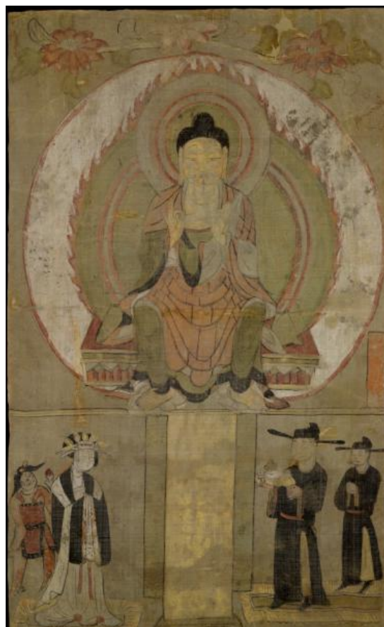
1919, 0101, 0. 30