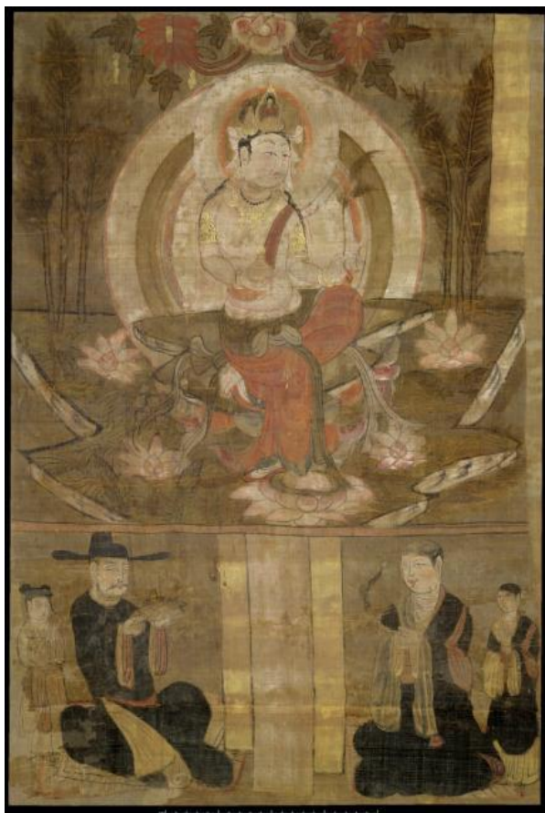
1919, 0101, 0. 29

在英國博物館藏 1919,0101,0.29、1919,0101,0.30、1919,0101,0.49（圖 7）等三幅繪畫品中，供養人像中間的題記框內是空白的，仔細觀察和詢問英國博物館的工作人員，確定這些空白處原本就沒有書寫痕跡，而不是年代久遠造成的文字脫落後留下的空白。吉美博物館藏編號為 EO.3581 的繪畫作品（圖 8），上部中間位置畫一尊菩薩像，兩側各畫一身仕女像，左右兩個還有兩方題記。下部供養人像列分成左右對稱的兩部分，左側 2 身男性供養人像，右側僅畫 1 身僧人像，僧人身後的位置是空白的，這幅畫中所有的題記框內也都空白無題記。美國弗利爾美術館藏編號為 1935.11 的繪畫品描繪的是地藏菩薩像（圖 9），畫面上部的地藏菩薩左手持如意寶珠坐在一條河的左岸，畫面下部中間位置有一大塊空白，僅左右兩側分別繪一菩薩像和女性供養人像。位於畫面右側的貴族女性供養人持香爐跪坐，身後站立兩身女婢，舉著蒲扇。女供養人前方有一行題記：“故大朝大於闐金王國天公主李氏供養”。