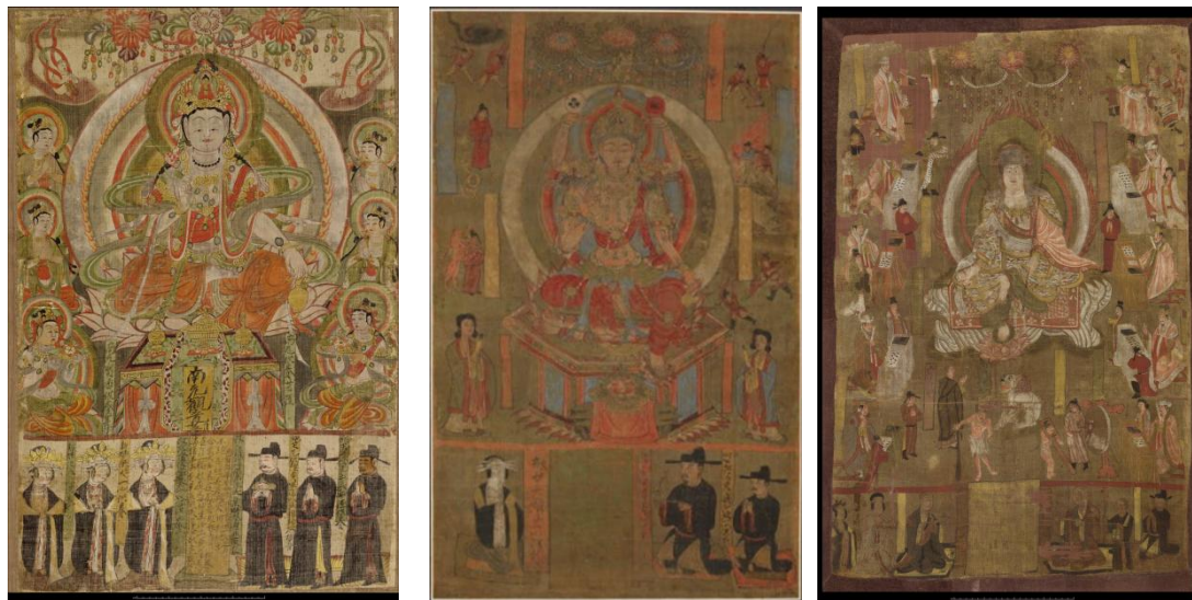
圖 1-3 左：1919,0101,0.52 中：1919,0101,0.28 右：1919,0101,0.23

由於此類絹畫數量較多，僅以英國博物館藏編號為1919,0101,0.52、1919,0101,0.28和1919,0101,0.23的絹畫為例（圖1-3），分析其畫面構圖特徵。畫面分為上下兩個部分，上部占整個畫面的3/4，描繪各類佛或者菩薩像，下部占畫面的1/4，畫數量不等的男女供養人像，供養人旁邊或中間有墨書題記。